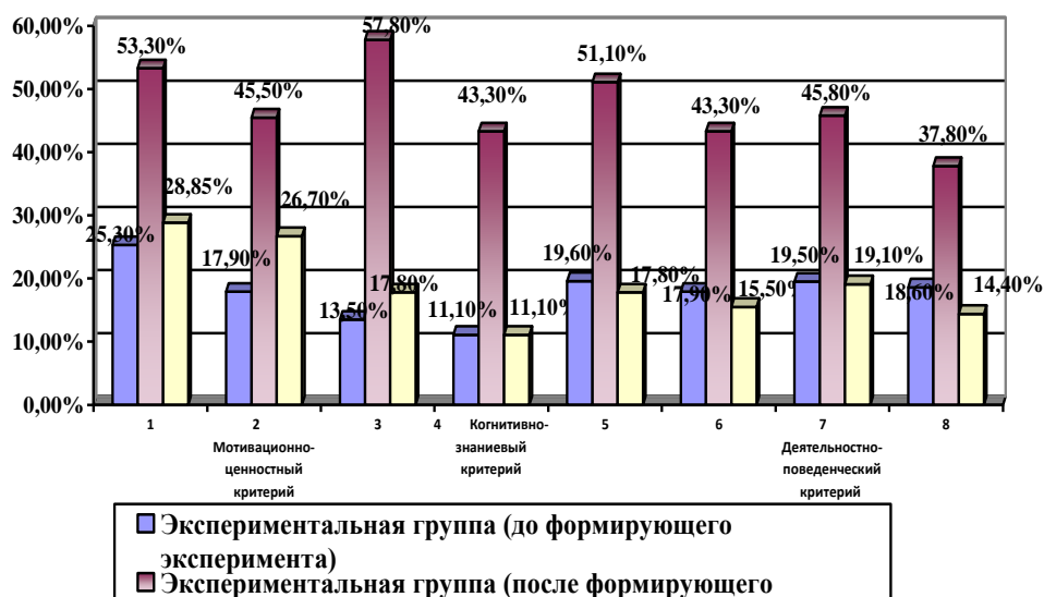
Рис. 1 Динамика доли молодых людей-респондентов, экспериментальной и контрольной групп, имеющих высокое значение уровня сформированности составляющих готовности к проявлению социокультурной мобильности согласно выделенным критериям и показателям в начале и по завершению формирующего эксперимента

Данные, свидетельствующие о сформированности готовности к проявлению социокультурной мобильности у молодых людей экспериментальной и контрольной групп до проведения формирующего эксперимента и по его завершению, согласно выделенным критериям и показателям, распределились следующим образом (рис. 1).